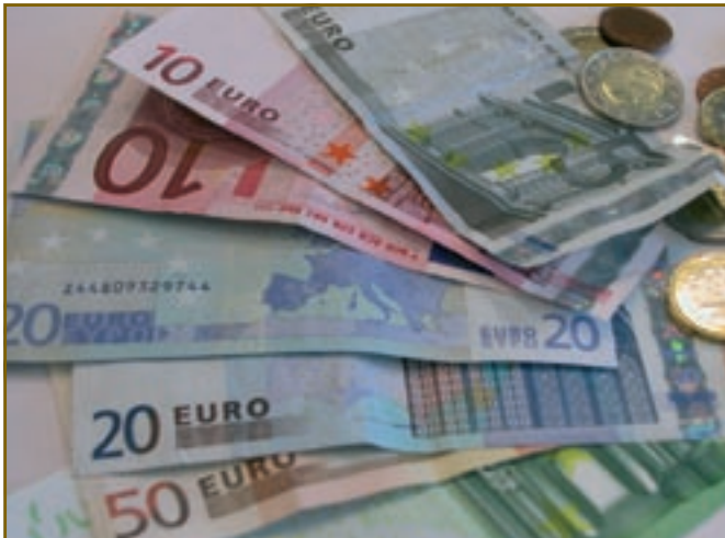
Partijfinanciering, alleen voor de traditionele partijen?

Voor alle duidelijkheid: partijen die voor corruptie veroordeeld zijn, zoals de SP.A en de Waalse PS, lopen geen risico hun partijfinanciering te verliezen. Het